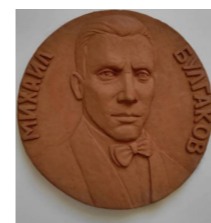
Медаль "Михаил Булгаков"

На факультете изобразительных искусств им. З. Исмагилова постоянно происходят интересные события. Талантливые и активные в реализации своих творческих замыслов студенты постоянно участвуют в различных конкурсах, выставках, происходящих в мире живописи, скульптуры и дизайна. Копилка лауреатских наград растёт, расширяя географию событий.