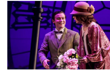
Фото со спектакля

изгнанных. Миражи Серебряного века», новая постановка Академии кинематографического и театрального искусства Н.С. Михалкова.