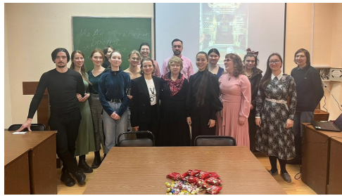
Фото с заседания

Фуко. Студенты постарались и подготовили наполненную разными символами афишу, а также придумали очень точное, приковывающее внимание, название – «Маятники Фуко».